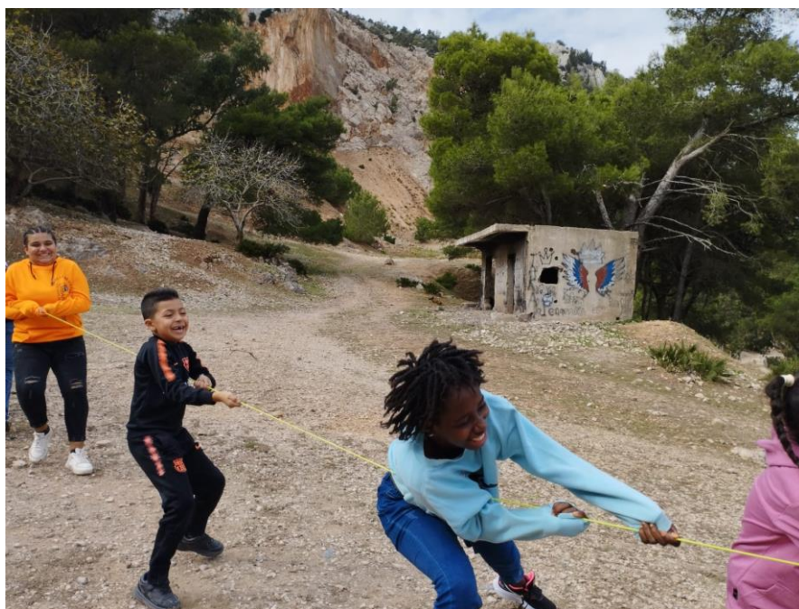
Niños y niñas participantes del proyecto en uno de los talleres de ocio.

Las situaciones a las que se enfrentan estos colectivos vulnerables son muy variadas: migración, familias desestructuradas, mendicidad. De ahí que el programa de intervención sea integral. Desde el inicio del proyecto se han prestado servicios de alojamiento, manutención, medicina y educación. También se han realizado diferentes talleres que contemplan actividades socioeducativas, creativas y de ocio, con el objetivo de mejorar las habilidades sociales y fomentar el trabajo en equipo.